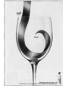
그림12,13) 애경산업(JWT Adventure)