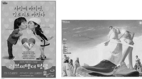
그림3)파파이스그림 4)한국 리복(대홍기획) (휘트닉스커뮤니케이션즈)

또는 그림3,4와 같이 사람의 모습을 다소 과장되게 변형시키거나 일상의 모습을 과장시켜 유머러스하게 표현하기도 한다.