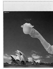
그림14) 필립스(레오버넷)그림15) 동서식품(제일기획)

즉 상품의 속성에 따른 소구 표현에서는 그 속성을 연상시킬 수 있는 이미지의 연합으로서, 시선을 유도하고, 의미전달을 가능케 하는 것이다.그림12,13은 샴푸 광고로 부드러운 머리카락을 표현하기위해 제품의 특성에 맞게 부드러운 머리카락과 와인, 소프트아이스크림을 절묘하게 합성하여 부드러운 머릿결을 만드는데 탁월한 효과가 있다는 특성을 직접적으로 연상되어지게 표현하였다. 그림14는 수돗물을 바로 받아 차를 타는 것만큼 빠른 시간 내에 물을 끓일 수 있다는 것을 신속하게 연상되도록 하였고, 그림15는 커피잔과 구름을 함께 결합시켜 제품인 카푸치노를 연상하게끔 표현하였다. 창조적 형태에 의한 비