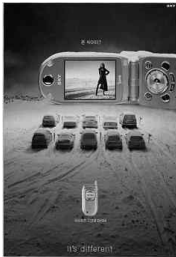
그림10) SK텔레텍(TBWA KOREA)