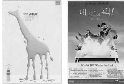
그림5) 해태음료(LG Ad) 그림6) 보강휘닉스 (휘닉스커뮤니케이션즈)

공간 즉, 초현실 상황을 제시하여 환상성을 유발, 호기심과 주목을 불러일으키고 있다.