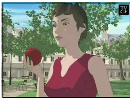
[그림 8] 참존 DeAge - 레드 에디션편 -

힘 쏟으며 불황의 타개책을 마련해 나가고 있다. 이러한 일련의 행위들은 기업의 이념과도 연관이 있어 기업이 추구하는 창조적 기업정신, 즉 독창성을 시각적으로 메시지화하고 소비자와 커뮤니케이션하여 신뢰와 사랑을 받아온 것이다. 과거 청개구리 한 마리가 앰파이어 스테이트 빌딩을 힘차게 뛰어오르는 장면을 보여줘 많은 이의 머리 속에 각인된 참존의 도전정신과 참신함은 오늘날 기술의 발전을 통해 새로운 느낌의 라인 애니메이션으로 그 역동성을 더해가고 있다. 화장품 광고에는 반드시 아름다운 유명 모델이 나와야 한다는 고정관념에서 탈피하여 청개구리의 힘찬 도약이 라인 애니메이션의 화사한 색감 속으로 뛰어든 것이다. 기존의 화장품 광고가 가진 크리에이티브의 표현한계와 여배우 기용에 대한 고정관념을 극복하고 기업의 정신을 소비자들에게 명확히 제시하며 더불어 제작비 절감과 높은 시각적 주목도의 효과를 이끌어 낸 참존 DeAge의 광고들은 참신함으로 빛을 더하는 라인 애니메이션광고의 사례라고 할 수 있다.