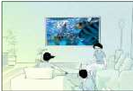
[그림 4] 삼성 SDI 기업 PR CM - 아파트 편 -

실제 완제품기기를 생산하는 회사가 아닌 PDP, 유기 EL 등의 중간재를 생산하는 B2B(Business to Business)기업인 삼성 SDI는 라인 애니메이션을 사용한 이번 광고를 통해 본래의 광고 목적인 SDI가 무엇을 하는 회사인지 알리는데 최상의 효과를 이끌어 내고 있다.