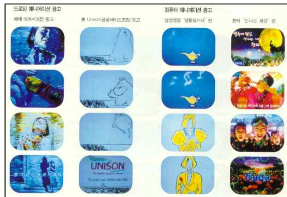
[그림 2] 드로잉 애니메이션, 컴퓨터 애니메이션 광고

흔히 컴퓨터 그래픽(CG)으로 불리는 컴퓨터 애니메이션 광고는 크게 두 가지로 구분된다. 하나는 동화가지 셀 애니메이션으로 작업한 후 스캐닝에 의해 디지털화해 채색 이후의 작업을 컴퓨터에 의존하는 것이고, 또 하나는 원화작업부터 디지털이라 불리는 도구를 이용해 컴퓨터에 직접 그리는 방법이다. 삼성 생명의 '생활설계사' 편, 비제바노의 '데탕뜨' 편 등이 전자에 속한다면, 웹시콜라의 '웹시 맨' 시리즈, 카프리의 '도시의 게' 편 등이 후자에 속하며 특히 후자의 경우는 한 사람이 한 장소에서 한 세트의 장비를 가지고 애니메이션의 모든 과정을 진행시킬 수 있다는 장점을 지니고 있다.