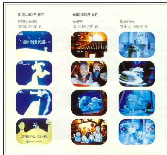
[그림 1] 셀 애니메이션 광고, 클레이메이션 광고

스톱모션 애니메이션은 입체감을 뚜렷이 느낄 수 있어 사실감을 줄 수 있고 사용되는 소재에 따라 독특한 질감을 표현할 수 있기 때문에 최근 각광받는 기법 가운데 하나이다. 그러나 속도감이나 감정의 특별한 표현이 어렵고 대량제작이 어려운 단점도 가지고 있다. 사용되는 소재가 찰흙이나 실리콘이나 인형이나, 종이냐에 따라 각각 클레이메이션(Claymation), 실리콘 애니메이션(Silicon Animation), 퍼펫 애니메이션(Puppet Animation), 종이 또는 컷아웃 애니메이션(Paper or Cut-Out Animation)으로 통칭되곤 한다. 대표적인 광고작품으로는 울트라 녹스의 '물에 녹는 화장지' 편, 삼성전자의 '또 하나의 가족' 편, 오리온 프리토레이의 '헥서스' 편, 해태음료의 '깜찍이 소다' 편, 제일모직의 '아이비 클럽' 편 등이 있다.