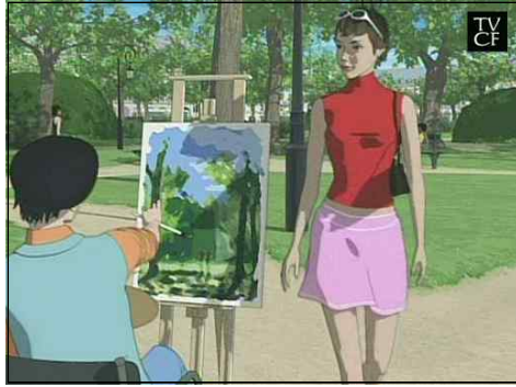
[그림 7] 참존 DeAge - 레드 에디션 편 -

힘 쏟으며 불황의 타개책을 마련해 나가고 있다. 이러한 일련의 행위들은 기업의 이념과도 연관이 있어 기업이 추구하는 창조적 기업정신, 즉 독창성을 시각적으로 메시지화하고 소비자와 커뮤니케이션하여 신뢰와 사랑을 받아온 것이다. 과거 청개구리 한 마리가 앰파이어 스테이트 빌딩을 힘차게 뛰어오르는 장면을 보여줘 많은 이의 머리 속에 각인된 참존의 도전정신과 참신함은 오늘날 기술의 발전을 통해 새로운 느낌의 라인 애니메이션으로 그 역동성을 더해가고 있다. 화장품 광고에는 반드시 아름다운 유명 모델이 나와야 한다는 고정관념에서 탈피하여 청개구리의 힘찬 도약이 라인 애니메이션의 화사한 색감 속으로 뛰어든 것이다. 기존의 화장품 광고가 가진 크리에이티브의 표현한계와 여배우 기용에 대한 고정관념을 극복하고 기업의 정신을 소비자들에게 명확히 제시하며 더불어 제작비 절감과 높은 시각적 주목도의 효과를 이끌어 낸 참존 DeAge의 광고들은 참신함으로 빛을 더하는 라인 애니메이션광고의 사례라고 할 수 있다.