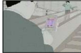
[그림 5] 삼성 SDI - 공항 편 -

일반적으로 독특한 기법의 광고영상들이 기법에만 치중하여 광고 본래의 목적과 의미를 잃고 일회성 선전에 그치는 경우도 부지기수이지만 삼성SDI의 라인 애니메이션 광고는 본래 광고의 목적에 충실할 뿐만 아니라 목적을 부각시키는 기법으로 역할을 하였고 더불어 독특한 기법을 보여줌으로 높은 시각적 주목도를 얻는데도 성공할 수 있었다.