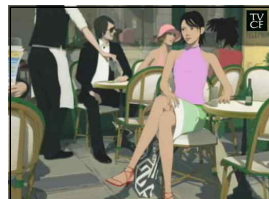
[그림 9] 참존 DeAge - 알바트로스 편 -