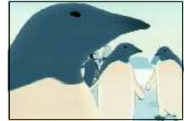
[그림 6] 삼성 SDI - 글로벌 편 -

라인 애니메이션의 따뜻하고 정감이 느껴지는 특성을 이용해 기업이 말하는 디지털 기술을 통한 휴머니티의 실현을 화면 속에서 이뤄낸 삼성 SDI의 광고에서 느낄 수 있듯이 라인 애니메이션이 줄 수 있는 색다른 느낌과 차별화된 영상과 접목하여 본래의 목적에 충실한 커머셜 메시지의 전달 가능성과 미래성을 기대할 수 있게 한 라인 애니메이션 광고의 대표 사례라고 할 수 있다.