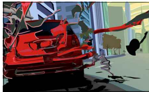
[그림 10] Toyota Matrix TV-CM

Matrix는 승용차와 SUV차량의 장점을 결합시킨 새로운 형태의 자동차로 젊은 감각의 스타일과 실용성을 강조하는 특성을 극대화하기 위해 라인 애니메이션을 사용하였고 그 효과 또한 분명하게 나타났다. 디테일하지 않은 면처리 방식을 통해 차가 주는 역동성의 이미지를 강화시켰고 수많은 끼어들기 벗겨져 나가며 실사로 전환되는 장면은 Matrix가 새로운 스타일을 추구한다는 점을 소구하는 목적과 새로운 형식의 3D 기법인 라인 애니메이션이 절묘하게 배치되어 소비자에게 강력하게 어필 할 수 있었다.