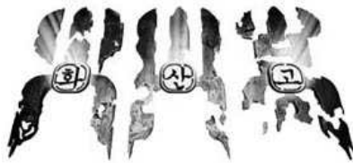
[그림 12] 화산고(2001)

형과 텍스처는 서로 결합되어 해석되어지며 한자로 표현된 형은 단순한 형이 아니라 글자와 묶여져 동등한 위치를 갖는다.