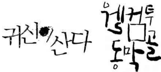
[그림 9] 귀신이 산다(2004), 웰컴투동막골(2005)

이는 시선을 집중시켜 타이틀 로고를 각인시키는 효과가 있으며 메시지에 담긴 의미나 감정을 생동감 있게 전달하는 장점이 되고 있다.