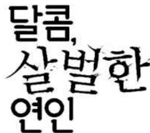
[그림 11] 달콤살벌한 연인(2005)

'달콤'과 '연인'은 부드러운 고딕계열의 서체로, '살벌한'은 명조계열을 쓰고 있는데, 살의 'ㅅ'획을 길게 빼어 칼날 같은 형태로 변형시켰으며 중간행의 글자를 로테이트하고 그 주위에 글자의 부스러기들을 피처럼 흩뿌려진 산중의 해체표현으로 제목에서 느껴지는 상반된 느낌을 잘 표현한 예이다.