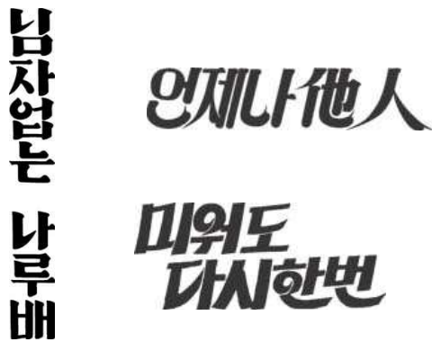
[그림 4] 님자없는 나룻배(1932), 언제나 타인(1969), 미워도 다시한번(1969)

가로쓰기도 완벽하게 정착되어 자유롭게 쓰여지며 공간을 알맞게 꾸미는 시도를 볼 수 있고 ‘언제나 타인’이나 ‘미워도 다시 한번’에서는 아직도 한자와 일본글자의 영향을 받은 모습을 찾아 볼 수 있다.