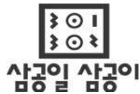
[그림 6] 삼공일 삼공이(1995)

그 예로 “삼공일 삼공이”는 이 시기에 개발되어 있던 탈네모꼴 서체의 구조를 보인다.