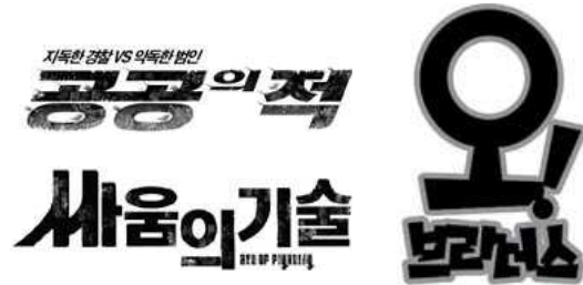
[그림 10] 공공의 적(2002), 오브라더스(2003), 싸움의 기술(2006)

'쓰'을 강조한 로고로 '싸움의 기술'은 2006년 개봉된 액션&코미디 영화로 자소와 글자의 크기, 높낮이를 적절히 조정하여 리듬감을 표현하고 표면의 분열현상이 일어난다. 기준선을 무시하여 리듬감 있게 표현하고 있다.