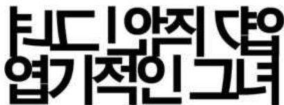
[그림 13]엽기적인 그녀(2001)

이러한 레이아웃은 영화포스터를 강조하며 주목률을 높이고 있다. 영화포스터나 타이틀 로고뿐 아니라 모든 디자인 분야에서 1990년대 이후 다양한 레이아웃의 실험을 통해서 차별화된 접근을 시도하고 있다.