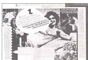
[그림 2] 볼프강 바인가르트 '타이포그래피세 모나츠 블라에터지의 안내란(1974)

글자체의 파괴는 과거 형이상학의 붕괴를 추구하는 해체의 한 방식이며 로고스 중심주의 6) 에 대한 해체이다.