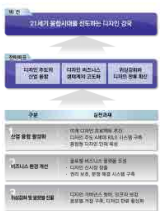
[그림 6] 창의산업창출을 위한 융합 디자인정책 프레임 28)

창의 산업 창출을 위한 융합 디자인 정책 개발과 추진의 조건으로, 공공부문에서는 그동안 정부에 의존하는 수직적 구조의 정책추진과 부처별 개별적인 칸막이 역할 27) 을 변화시켜 수평적 구조의 새로운 정책패러다임 구조의 융합을 준비해야 한다. ICT 기술기반의 환경에 살고 있는 지금 산업융합을 위해서는 R&D와 디자인과의 협업이 무엇보다 필요하다. 이를 위해 디자인융합 R&D시스템의 확산과 이를 운용하기 위한 전문 인력양성은 물론 디자인의 업무영역을 넓히기 위해서는 서비스분야 디자인 등 혁신사업 발굴과 여건마련을 위한 디자인 인프라 강화 역시 필수적이다. 이를 통해 창조경제를 견인하는 미래상을 제시하고 21세기 융합시대를 선도하는 디자인 강국으로 발돋움할 수 있을 것이다.