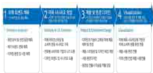
[그림 4] Design of the Future 사업 프로세스 16)

그 외에 디자인이 산업 간의 융합에 있어 리더십과 설득력을 갖기 위해서는 ‘그리는 디자이너’ 보다는 ‘생각하는 디자이너’를 통해 소비자의 니즈(Needs), 시장, 고객가치를 충족시킬 수 있는 미래 디자인의 대두는 필연적이라 할 것이다. 지멘스, 필립스, 삼성전자 등 글로벌 기업들은 이미 90년대 중반부터 ‘미래 디자인 프로젝트’ (Design of the Future)를 추진해 오고 있다. 미래의 디자인트렌드 및 가치를 파악하기 위해 이제까지의 디자인을 인문, 사회, 과학, 경제, 문화 등의 시대적인 특성과 비교하여 디자인의 변화유형, 변화의 내용과 특성 및 이들 변화와 제 환경요인과의 구조적 상관관계를 분석하고 규명함으로써, 이를 바탕으로 현재와 미래의 트렌드를 예측, 파악할 수 있는 새로운 기법의 개발을 시도하여야 하는데 이러한 다학제적(多學際的)인 융합의 중심에 디자인이 있어야 할 것이다.