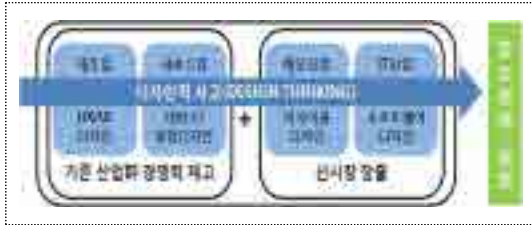
[그림 3] 창조경제에서 디자인의 역할 15)

로 영국항공은 2000년 영국 탠저린사(社)를 통해 비즈니스석 디자인을 Box형에서 S자형으로 개선 14) 하여 사용자 편의 증진과 연간 8천억 원의 영업이익 증가를 가져왔다.