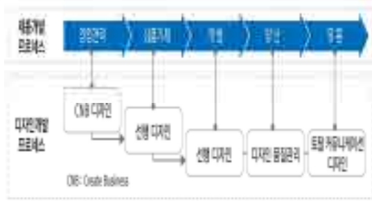
[그림 5] 제품개발 프로세스 단계별 디자인 참여 방안 17)

이를 위해 [표 3]와 같이 산업통상자원부(산업부)는 2013년도에 17개의 R&D사업에 537억원을 반영하였다. 이는 2010년도를 시작으로 매년 급격히 늘어나고 있는 추세 18) 로 디자인융합 R&D시스템 확산이 산업융합 추진을 위한 필수요인이라는 것을 보여준다 하겠다.