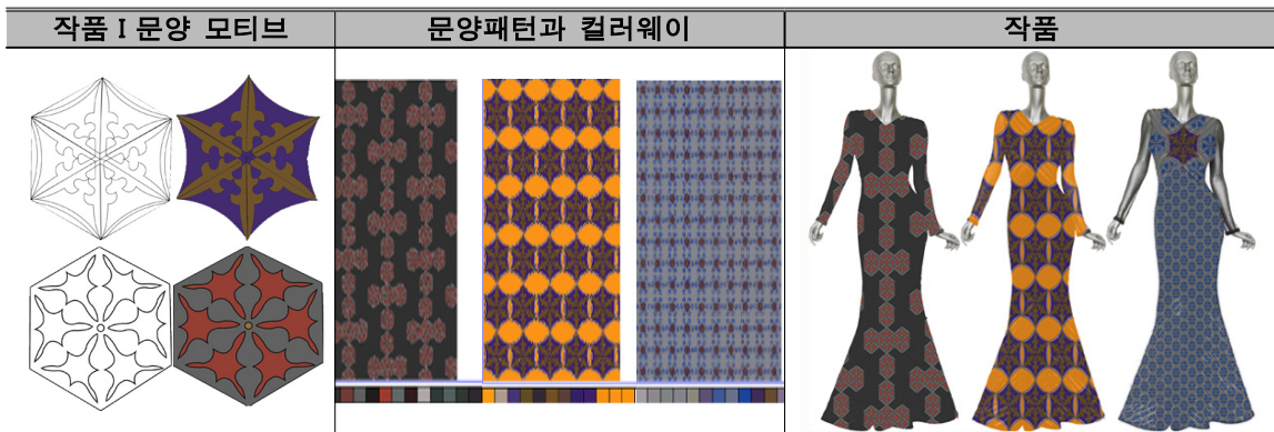
[표 5] 작품 I