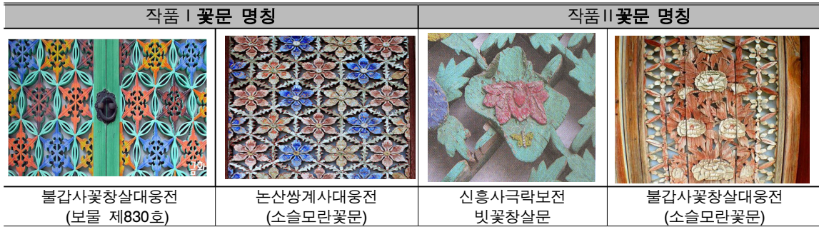
[표 4] 작품 I, 작품 II의 꽃창살문

화려한 평면적인 꽃창살이다. 가장 화려하고 정교한 미를 가진 꽃창살의 바닥창살무늬를 배제하고 모란꽃문양을 단순화시켜 연꽃문양과 조화되게 현대적으로 재구성하여 실루엣은 단순하고 여성미의 허리를 강조하여 우아하고 아름다움을 작품으로 표현하였다[표4][표 5].