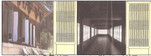
[그림 1] 우물살문 [그림 2] 띠살문