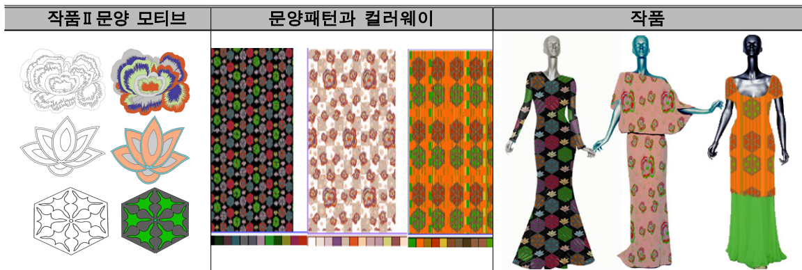
[표 6] 작품Ⅱ