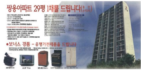
[그림 1] 98년 롯데 바겐세일+아파트경품 전단광고

걸었다. 백화점 최초 아파트 경품이 걸린 행사에는 약 90만 명의 사람들이 몰려 폭발적인 반응을 보였다.