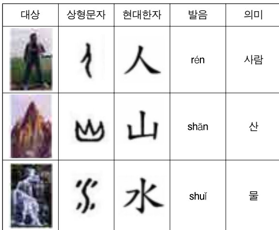
[그림 1] 한자의 상형적 특징과 의미

한자는 소통과 조형적인 측면에서 크게 4가지 특징을 가지고 있다. 첫째, 한자는 그 형태를 통해 의미를 쉽게 이해할 수 있다. 초기 한자는 사물의 형상을 모방하여 그린 상형문자이어서 이미지의 연상을 통해 의미를 쉽게 파악할 수 있다. 특히 人(사람, rén), 山(산, shān), 水(물, shuǐ), 鳥(새, diǎo)[그림1] 등과 같이 단순한 글자로 된 단어는 실제 대상의 형상과 매우 유사한 문자의 형태로 인해 쉽게 읽을 수 있고 기억할 수 있다. 후에 추상적인 이미지와 개념을 표현하는 표의문자로 발전했지만 표의문자도 상형자들이 결합하여 의미를 형성하기[표 1] 때문에 영문 알파벳 등 타 문자에 비해 의미를 쉽게 파악할 수 있다.