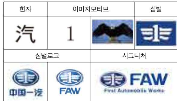
[그림 9] 제일자동차회사 브랜드디자인

최초의 자동차는 스티밍 엔진을 동력으로 사용했기 때문에 중국인들은 자동차를 汽車(qìchē)라고 부른다. 지금은 가솔린 혹은 전기 등과 같은 새로운 에너지원으로 대체되었지만 중국에서 汽는 여전히 자동차를 의미한다. 심벌은 형성자인 汽(중기, qì)자를 활용하여 중국 최초의 자동차 기업(First automotive works)임을 상징적으로 표현하고 있다. 자동차 분야에서 최초이자 1위임을 표시하기 위해 지사자인 숫자 1을 기본 요소로 사용하였고 왼쪽 변은 汽(중기, qì)자의 水(물, shuǐ)를, 오른쪽 변은 气(기체, qì)자를 활용하여 디자인하였다. 그리고 숫자 1과 汽자의 결합은 날개를 활짝 편 독수리의 이미지가 연상되도록 의도되었다. 배경의 밝은 파란색(blue sky)은 하늘 즉, 세계무대를 상징하고 있어 중국제일자동차회사가 세계를 무대로 더 멀리, 더 높이 뻗어나감을 의미한다. 심벌의 타원 길이와 넓이는 황금비율의 근사치로 디자인이 되어 있다[그림 9].