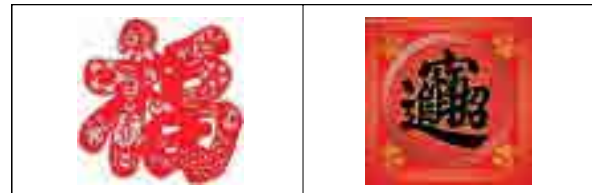
[그림 5] 커팅문자