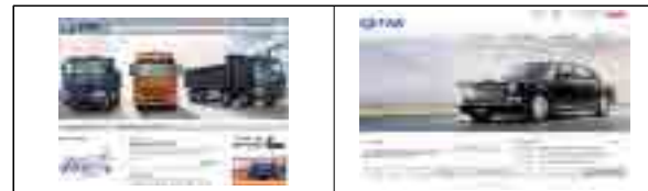
[그림 10] 제일자동차회사 러시아어(좌), 영문(우) 웹사이트

중국제일자동차회사는 중문, 영문, 러시아어 홈페이지를 운영[그림 10]하고 있으며 알제리, 카메룬과 같은 아프리카를 비롯해 전 세계 26곳에 지점, 대표 사무소, 딜러 사무실을 운영하며 12만 명에 이르는 고용인과 70여 수출대상국에게 한자로 제작된 심벌디자인이 중국제일자동차회사의 기업이념을 전달하고 있다.