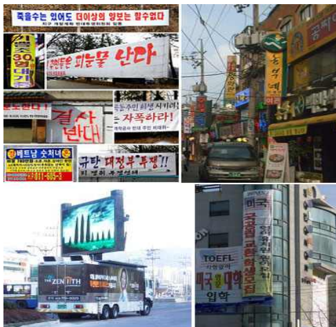
[그림6] 경관불법형 옥외광고

불법형 옥외광고물은 옥외광고법의 규정을 위반하면서 설치함으로써 도시미관을 흐리며 또한 무질서하고 과도한 양적 팽창과 함께 심각한 시각적 공해를 일으키는 주범이 되고 있다. 현재 우리나라에 설치되어 있는 옥외광고물은 약 60~ 70%가 불법형이라고 하니, 그 심각성은 대단하다고 할 수 있다.