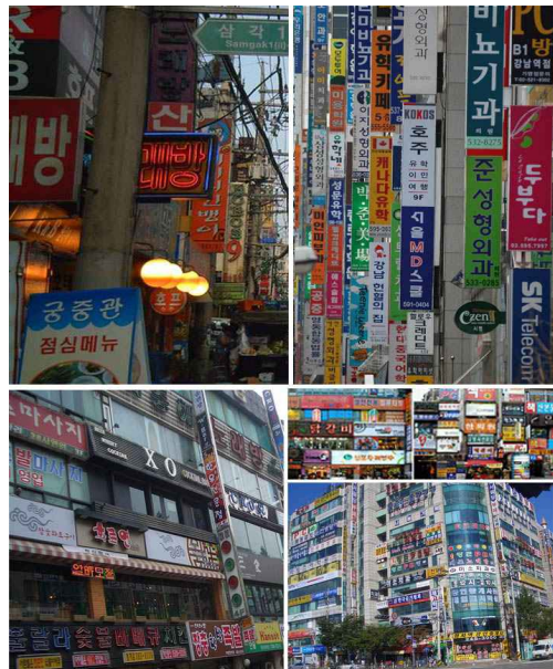
[그림4] 경관 파괴형 옥외광고

레스토랑, 커피숍 등)점포주 입장에서 볼 때에 보다 더 자극적이고, 보다 더 현란하게 경쟁적으로 설치하기 때문에 더욱 복잡하고 무질서한 경향을 나타내고 있다.