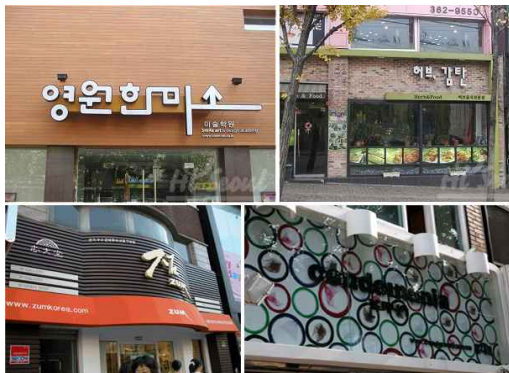
[그림2] 경관 창조형 옥외광고

대형 업무용 빌딩밀집지역이나, 신시가지등에서 볼 수 있는 형태로서 대부분 기업체의 C.I 등이 계획적으로 주변경관과의 조화와 새로운 이미지를 창조하기위하여 전문 디자이너 등에 의해 제작 설치된 옥외광고물들이 여기에 해당되는데 비교적 법적 규제 사항을 잘 준수하면서 지역특성과 주변경관 등에 잘 조화를 이루도록 설치된 경우이다. 이러한 경관창조형의 옥외광고물은 시민들로 하여금 식별성이나, 인지성 등이 뛰어나기 때문에 오히려 광고효과를 극대화 시킬 수 있으며 지역 주민들로부터 좋은 이미지를 가지고 있기 때문에 적극 지도 장려해야 하는 형태라 볼 수 있다.