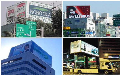
[그림5] 경관 정복형 옥외광고

이러한 형태는 대부분이 거대한 옥탑광고 혹은 도로변의 대형 광고물(Bill Board)을 들 수가 있다. 상업시설이 별로 형성되어있지 않은 지역이나 행정적 관리가 비교적 소홀한 지역 등에서 주변의 자연 경관과는 상관없이 거대한 옥외광고물을 설치함으로써 경관을 파괴하는 형태이다. 또한 도시내 거대한 옥탑광고물의 경우도 주변경관이나 건물의 크기 등은 고려하지 않고 오히려 광고물이 건물보다도 더 큰 경우, 이러한 경우는 빼어난 도시경관을 헤치거나, 풍치나 미관을 해치면서 제도상 분류되어 있지 않은 불법적 설치물을 볼 수 있다. 도로변의 대형광고물은 보행자나 주민들을 이용한 광고라기보다는 차량 승객을 위한 광고물로서 자연녹지 지역 안에 대부분이 설치되는데 화곡동 인공폭포 주위의 광고물이라든가 한강 도로변의 대형 입간판 등이 여기에 해당된다고 볼 수 있다.