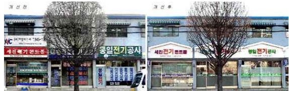
[그림1] 옥외광고물의 개선 전후비교5)

또한, 일본에서의 옥외광고물에 대한 법적 정의는 "옥외광고물이란 상시 또는 일정한 기간 계속하여 옥외에서 공중에 표시된 것으로 간판, 입간판, 벽보 및 전단 또는 광고탑, 건물과 기타의 공작물 등에 부착되거나 또는 표시되는 것과 그에 준하는 종류의 것을 말한다. 따라서 옥외광고물에 대한 정의를 정리하여 보면 건물 외부에서 볼 수 있는 것으로서 일정한 공간을 점유하여 존재하며 불특정 다수인의 가시영역에 시각적인 자극을 줌으로써 소기의 목적을 소비자(수요자)에게 전달하고자 하는 목적으로 설치된 것을 옥외광고물이라고 정의한다.