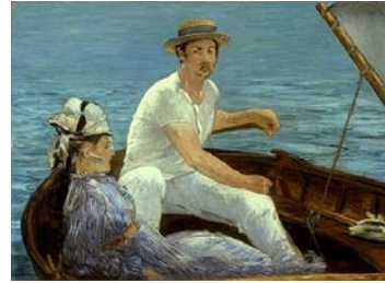
[그림 1] Boating(1874).

1874년 제작된 마네의 그림에 나타난 티셔츠 차림의 남자를 통해서 19세기 후반에 오늘날 개념의 티셔츠가 이미 생활 속에서 입혀지고 있었다는 것을 알 수 있다(그림 1).