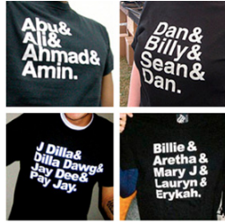
[그림 5] 문자 티셔츠.