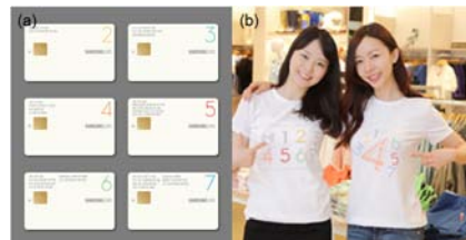
[그림4] 삼성 숫자 카드 티셔츠

3.1.2. 레터링 - 레터링이란 디자인 용어로 디자인의 시각화를 위해 문자를 그리는 것, 또는 그려진 문자를 의미한다(송선영, 2005). 글자체로서의 일정한 법칙이 있다는 점이 자유롭게 손으로 쓴 글씨와 다른 점이며(김은하, 조진숙, 2008), 문자, 숫자나 기호 등을 디자인 요소로 활용하며 이들을 크기나 모양, 위치 등을 다양하게 조합하여 메시지 전달과 더불어 신선하고 독특한 감각 창출하는 것이다. 브랜드명을 티셔츠에 크게 표현함으로써 소비자들에게 우월감과 자신감, 사용자의 만족도 상승에 기여하는 역할을 하며 상업적 특성을 보여주는 로고나 마크, 엠블렘 등으로 제품의 우수성과 상징성 나타낸다. 럭셔리 브랜드의 대표적인 샤넬에서는 샤넬의 상징적 숫자인 5를 강조하는 디자인으로 브랜드의 정체성을 표현하였다(그림 3). 자사의 브랜드 홍보를 위해 패션사와 협력하여 티셔츠를 제조하는 경우도 있다. 에잇 세컨즈와 삼성숫자카드의 콜라보레이션 티셔츠로 에잇 세컨즈에서 판매한 숫자 티셔츠를 보면, 삼성숫자카드의 1-7까지의 숫자를 모티브로 하여 에잇 세컨즈의 크리에이티브 감성을 믹스한 제품이다(그림 4). 디자인M 티셔츠에서는 미국의 티셔츠회사 제품인 '비틀즈(Beatles)' 멤버들의 이름이 프린트 된 티셔츠를 그대로 차용하여 소비자들에게 '비틀즈' 멤버들의 이름 대신 자신들의 이름으로 바꿔서 착용할 수 있는 문자 티셔츠로 소비자들의 반응을 이끌었다(그림 5).