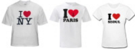
[그림 15] 문자 활용 티셔츠.

도시를 상징하는 다양한 티셔츠들이 등장하였다(그림 15). 도시의 이름이 적힌 티셔츠는 국민적 일체감을 조성하고 문화정체성 높일 뿐 아니라 국제사회에서 그 나라의 이미지를 부각하는데 매우 중요한 역할을 하고 있다.