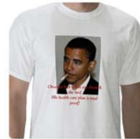
[그림 20] 헬스케어정책과 오바마 풍자티셔츠.