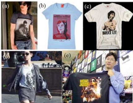
[그림 6] 유명인이 프린팅 된 티셔츠.

대중화된 이미지를 디자인으로 활용한 티셔츠는 일상생활 속에서 흔히 접하는 기존의 이미지가 소재이다. 먼저 대중화된 유명인물의 얼굴을 표현 대상으로 이용한 것을 보면 마릴린 먼로, 엘비스 프레슬리, 체게바라, 간디, 벡컴 등 유명인들이 다분히 재현적으로 표현되어 대상의 특징을 상실하지 않은 채 형태와 색이 단순화되어있고 그와 관련된 상징적 의미를 내포하고 있음을 볼 수 있다. 또한 꽃과 생물체, 장식적 심벌, 인공물 등을 주제로 하여 복제한 것, 인체를 디자인의 표현 대상으로 한 것 등 다양한 구성과 배열로 이미지의 대중화, 형상의 복제, 표현기법의 보편화 등을 통한 팝아트적 효과의 티셔츠로 창조된 것을 볼 수 있다(그림 6).