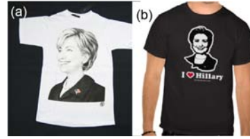
[그림 13] I love Hillary 티셔츠.