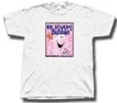
[그림 17] 집값 거품을 풍자한 티셔츠. 출처: http://www.edaily.co.kr/news/NewsRead.edy?SCD=DD15&newsid=01131606576668304&DCD=A00307

스케어 개혁을 정책으로 내세우면서도 아직 담배를 끊지 못한 오바마 대통령을 풍자한 티셔츠이다. 헬스케어 개혁법안(Health care reform Bill)이 통과된 후 강력하게 금연 캠페인을 시행하고 있는 정부 입장으로서 대통령이 먼저 담배를 끊지 않으면 본인 건강은 물론 정책적으로도 공격 대상이 될 수 있음을 염려하여 오바마의 금연 여부가 세간의 주목이 되었던 시기에 등장한 티셔츠이다.