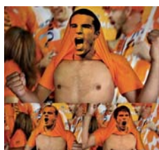
[그림 10] 착시효과

이러한 티셔츠들에 대한 세간의 평가는 유머감과 패션 감각을 모두 충족시켜주는 티셔츠라는 긍정적인 평가와 주변을 난감하게 만드는 패션 테러리스트의 무기라는 비난이 양립한다(팝뉴스, 2012. 10. 4).