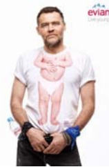
[그림 22] 에비앙 홍보용 티셔츠.