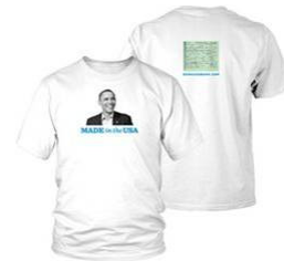
[그림 14] 오바마 출생증명서 티셔츠.