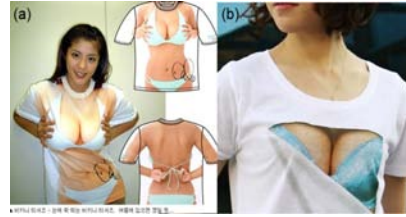
[그림 11] 착시효과