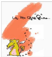
[그림 18] 정책을 비판하는 풍자 티셔츠.

유희와 오락성 개성표출의 경우를 살펴보면 착시효과를 활용한 유머 아이템으로서의 티셔츠 유행을 들 수 있다. 이는 벗은 알몸이나 해부학적인 그림의 프린팅으로 착시효과를 주며 유머러스한 이미지를 전달하는 것이 특징이다. 유머와 오락을 통한 개성의 표출은 현대의 대중적 일상에 만연해 있는 조류이며 패션에 있어서도 예외는 아니다. 착시효과를 주는 티셔츠는 사람들에게 잠재되어 있는 개그 본능과 자신을 어떠한 방식으로든 표출하고 드러내고 싶어 하는 현대대에 특성과 부합되어 대중의 인기를 끌고 있다. 그러나 이러한 티셔츠의 유행은 현대인의 유머감과 패션 감각 모두 충족시켜주는 티셔츠라는 긍정적인 시각과, 보는 이들을 당황하게 만드는 패션이라는 비판적인 시각이 양립한다.