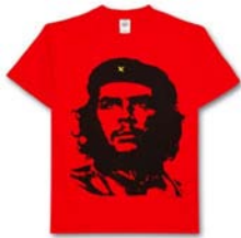
[그림 12] 체 게바라 티셔츠. 출처: http://blog.ohmynews.com/booking/221831

있음을 의미한다. 현대에 가까울수록 후보자의 사진이나 이름, 슬로건 등을 티셔츠에 표현하는 내용이나 방법이 다양해지고 있으며 후보자들의 모습을 캐리커처로 디자인하거나 예술사조에 접목시켜 티셔츠에 프린트한 것을 볼 수 있다. 힐러리 클린턴(Hillary Clinton) 상원의원을 홍보하는 수단으로 루이비통의 수석디자이너인 마크 제이콥스(Mark Jacobs)가 팝아트 기법을 사용하여 티셔츠를 디자인 한 것을 보면 7가지 색의 힐러리의 얼굴을 실크스크린 하고 'I love Hillary'라는 태그를 붙인 것으로 이 티셔츠는 유권자에게 그녀의 대중적인 이미지와 친근감을 끌어내는데 성공적으로 이용되었다(그림 13).