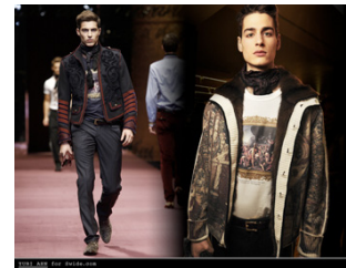
[그림 7] 명화 활용 티셔츠.

예술작품을 디자인으로 활용한 티셔츠는 일반적으로 명화를 이용한 형태이다. 의류 브랜드 '썬스데이 아일랜드'는 2011년 '오르세 미술관전'과 합작해 티셔츠 시리즈를 제작하였는데 완관이 될 정도로 폭발적인 반응을 보였고 브랜드 자체에 대한 관심도 증대돼 전체 매출 신장에 큰 도움이 되었다(인터넷 고대신문 쿠키, 2012. 10. 29). (그림 7)은 파리 루브르 박물관에 소장되어 있는 명화인 David의 'Leonidas and Themopylae'를 프린트한 D&G 티셔츠이다. "올가을에는 당신의 가슴에 명화 액자를 거세요" 라는 홍보용 메시지와 함께 발표하였고 이상적인 미(ideal beauty)에 대한 현대인의 욕구를 채워주는 티셔츠이다(D&G, FW/09). (그림 8)의 'Vitruvian Trooper 티셔츠'는 레오나르도 다빈치의 스케치인 'Vitruvian Man'에서 영감을 받은 스타워즈(Star Wars) 티셔츠이다.