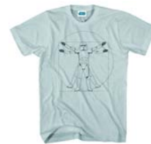
[그림 8] 명화 Vitruvian Man 활용 프린팅 티셔츠.