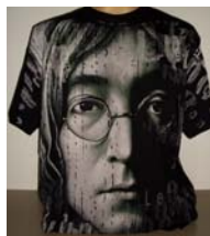
[그림 16] rock star John Lennon 사진 티셔츠.

우상화된 스타는 매스미디어 영향권 안에 살고 있는 우리시대와 사회가 만들어낸 욕구이다. 이것은 텔레비전, 영화, 잡지 등을 일상으로 접하는 대중에게 필연적 결과로서 개인의 기호와 정체성을 표현하는 방법으로 대중은 스타나 한 시대를 풍미했던 위대한 인물이 그려진 티셔츠를 착용함으로써 꿈을 공유하거나 추억이나 정신적 만족감을 얻을 수 있다(엽효, 2008). (그림 16)은 팬들 사이에 큰 인기를 끌었던 록 스타가 프린트된 티셔츠로 사람들은 자신이 좋아하는 스타의 모습이나 이름이 새겨진 티셔츠를 착용함으로써 충성심을 과시하고 연대감을 얻을 수 있다. 이렇게 착용된 티셔츠는 자신의 기호를 표시하는 매체가 되기도 한다.