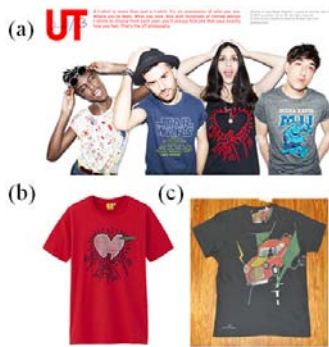
[그림 2] 유니클로 프린팅 티셔츠