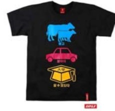
[그림 19] 비싼 대학등록금 풍자 티셔츠.

유희와 오락성 개성표출의 경우를 살펴보면 착시효과를 활용한 유머 아이템으로서의 티셔츠 유행을 들 수 있다. 이는 벗은 알몸이나 해부학적인 그림의 프린팅으로 착시효과를 주며 유머러스한 이미지를 전달하는 것이 특징이다. 유머와 오락을 통한 개성의 표출은 현대의 대중적 일상에 만연해 있는 조류이며 패션에 있어서도 예외는 아니다. 착시효과를 주는 티셔츠는 사람들에게 잠재되어 있는 개그 본능과 자신을 어떠한 방식으로든 표출하고 드러내고 싶어 하는 현대대에 특성과 부합되어 대중의 인기를 끌고 있다. 그러나 이러한 티셔츠의 유행은 현대인의 유머감과 패션 감각 모두 충족시켜주는 티셔츠라는 긍정적인 시각과, 보는 이들을 당황하게 만드는 패션이라는 비판적인 시각이 양립한다.