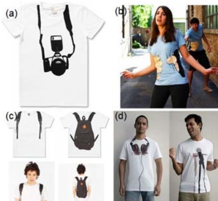
[그림 9] 착시효과

일본의 그라니프 티셔츠(graniph concertual design)에서는 가방을 멘 것 같은 착각을 주는 티셔츠를 포함하여 넥타이, 카메라, 헤드폰 티셔츠를 선보여 화제가 되었는데(그림 9), 네델란드의 한 광고 학교 학생들이 제작한 골 세리머니 응원 티셔츠 같은 경우 월드컵에 쓸 수 있는 아이템으로 축구경기 관람 시 티셔츠를 뒤집어쓰면 좋아하는 선수 얼굴로 변신하여 팬과 선수의 일심동체를 구현하는 티셔츠이다(그림 10).