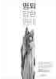
[그림 16] 2011, 일반부 (명퇴 당한 명태)