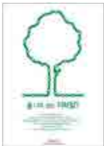
[그림 9] 2010, 일반부 (녹색교통 푸른지구)

<그림 10> '우리가 마시는 것' 광고에서는 산업도시에서 볼 수 있는 매연 나오는 굴뚝과 우리가 입으로 마시는 스트로를 결합하여 새로운 표현 형태로 비주얼을 표현하였으며, 매연 나오는 곳과 스트로 마시는 곳을 하나로 결합하여 경각심을 주기 위한 컨셉을 암시적으로 내포한 은유적 표현의 광고이다.