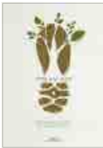
[그림 7] 2010, 학생부 (자연을 살리는 움직임)

<그림 7> '자연을 살리는 움직임' 광고는 '저탄소 녹색성장'을 주제로 한 광고로 자동차 대신 걷는 발걸음이 우리의 자연을 살릴 수 있다는 메시지를 카피와 비주얼로 표현한 긍정적 소구표현 광고이며, 비주얼과 메시지를 통해 우리가 얻게 되는 이익을 강조해 표현하고 있다. <그림 8> '국보 1호' 광고는 국보 1호인 승례문의 비주얼 형태를 나무의 푸른 자연으로 형상화하여 보여줌으로써, 우리가 지켜야 할 유산으로써 자연을 강조하고 있으며, 비주얼과 메시지를 통해 공공의 이익과 추구해야 할 가치를 전달하고 있는 긍정적 소구표현의 광고이다.