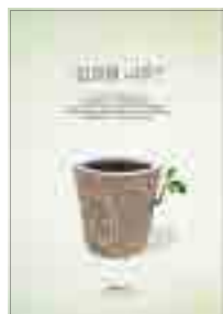
[그림 18] 2010, 일반부 (일회용 나무)