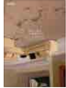
[그림 2] 2013, 학생부 (충간소음)