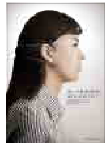
[그림 6] 2012, 일반부 (가면을 써야 했다)