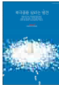
[그림 19] 2011, 일반부 (발자국·북극곰)

광고의 헤드라인을 중심으로 한 레이아웃 표현은 중앙 맞춤이 30편으로 가장 많이 나타났고, 앞줄 맞춤 9편, 뒷줄 맞춤 7편, 기타 5편, 없음 1편으로 나타났다. 레이아웃 구성상 헤드라인과 바디카피가 다르게 표현된 것은 기타로 분류하였고, 차별화된 뒷줄 맞춤 레이아웃도 7편으로 나타났다. 이러한 결과는 공익광고와 공모전이라는 특성상 비주얼과 카피가 임팩트 있게 명확히 전달되어야 하는 측면으로 해석할 수 있다. <그림 19> '발자국' 광고에서는 헤드라인 카피와 메인 비주얼이 모두 중앙 맞춤으로 레이아웃이 구성되어 있어, 카피와 비주얼을 같은 시선으로 볼 수 있는 표현으로 구성되어 있다. <그림 20> '수도꼭지' 광고에서는 헤드라인과 바디카피 모두 앞줄 맞춤으로 표현되었다. 수도꼭지에서 떨어지는 물 한 방울의 비주얼에 집중할 수 있도록 시각적 시선의 흐름에 따라 앞줄 맞춤으로 표현하였고, 비주얼과 카피의 흐름이 보다 쉽게 이해할 수 있도록 표현한 광고이다.