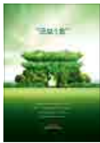
[그림 8] 2012, 일반부 (국보 1호)