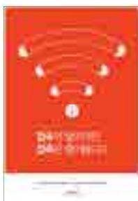
[그림 17] 2012, 일반부 (접속과 접촉)

공익광고 헤드라인 표현에서 타이포그래피는 고딕체 25편, 명조체 21편, 기타 5편, 없음 1편으로 나타났고, 고딕체가 조금 더 많이 나타났으며, 기타 5편에서는 다양한 서체가 나타나기도 하였다. 이는 공익광고의 특성상 사회적 문제에 대한 광고메시지를 보다 명확히 전달함으로써, 가독성과 판독성 측면에서 고딕체가 조금 더 선호되는 것으로 해석해 볼 수 있다. <그림 17> '접속과 접촉' 광고에서는 헤드라인을 고딕체로 표현하여, 카피 메시지가 강조되어 보이게 하였고, 바디카피도 고딕체로 통일감 있게 표현하였다. <그림 18> '일회용 나무' 광고에서는 헤드라인과 바디카피 모두 통일감 있게 명조체로 표현되었다.