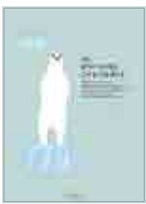
[그림 14] 2011, 학생부 (나는 판다가 아니에요)