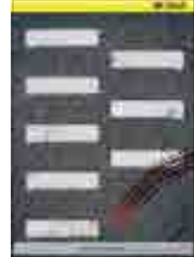
[그림 4] 2013, 학생부 (아무개님이 퇴장하셨습니다)