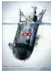
[그림 5] 2009, 일반부 (폭탄 총알)

<그림 5> ‘폭탄 총알’ 광고는 우리가 일상생활에서 사용하는 샴푸나 세제가 생활폐수가 되어 돌아온다는 메시지를 폭탄 총알 비주얼과 WAR라는 메시지로 부정적 측면을 통해 경각심을 일깨워주기 위한 부정적 소구표현이다. <그림 6> ‘가면을 써야 했다’ 광고는 우리 사회 전반에 만연해 있는 외모지상주의의 부정적 측면을 강조한 소구표현이다. 여성의 얼굴에 가면 마스크를 씌워 여성의 진짜 모습이 아닌 우리 사회가 원하는 외모로 보여야 하는 현실적 피해를 통해 경각심을 고취시키기 위한 부정적 소구표현이다.