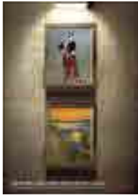
[그림 15] 2010, 학생부 수상작 (아름다운 선율도 이웃에게는...중략)

색상 표현은 칼라 48편, 흑백(모노톤) 2편, 기타 2편으로 나타났고, 거의 대부분 칼라로 표현되었다. 이는 광고 비주얼 표현에서 사진의 리얼리티 한 표현과 연관이 있으며, 칼라로 색상을 표현해야 비주얼 전달력이 명확하고, 색감을 통해 비주얼의 느낌을 보다 쉽고 명확하게 전달할 수 있기 때문이다. <광고 15> '아름다운 선율도 이웃에게는 고통이 됩니다' 광고에서는 세계 유명한 명화를 메인 비주얼로 표현하였고, 우리가 익히 알고 있던 명화의 느낌을 그대로 전달하기 위해 칼라 색상으로 표현하였다. <광고 16> '명퇴 당한 명태' 광고는 광고 컨셉과 메시지를 효과적으로 전달하기 위해, 메마르고 푸석한 느낌을 강조한 흑백(모노톤)의 색상으로 비주얼을 표현한 광고이다.