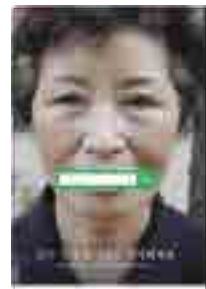
[그림 13] 2013, 일반부 (삶의 지혜)

공익광고 비주얼 이미지는 사진 표현이 42편으로 압도적으로 많이 나타났고, 일러스트 표현 7편, 기타 3편으로 나타났다. 이는 사회적 문제와 이슈를 주제로 한 공익광고의 특성상 사실적 표현의 비주얼 이미지가 메시지 전달이 명확하고, 느낌을 극대화 할 수 있기 때문으로 볼 수 있다. <그림 13> '삶의 지혜' 광고에서는 삶의 지혜를 찾을 수 있는 어르신들의 모습을 리얼리티 한 느낌이 그대로 사실적으로 전달될 수 있는 사진 이미지로 표현하고 있다. <그림 14> '나는 판다가 아니에요' 광고에서는 일러스트 표현으로, 지구온난화 때문에 걱정과 근심이 많은 북극곰이 판다처럼 눈 주위가 검게 되어 있는 모습을 일러스트로 표현하여, 광고 메시지의 심각성을 일러스트로 완화하여 표현하고 있는 광고이다.