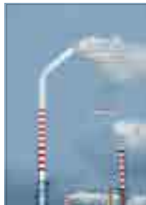
[그림 10] 2010, 학생부 (우리가 마시는 것)

<그림 11> '고개 들어요 대한민국' 광고는 스마트폰 중독에 대한 메시지를 전달하는 광고로, 우리나라 국민들이 스마트폰 사용 때문에 고개를 들지 못하고 시선이 아래를 향하고 있는 모습을 사실적 표현하고 있다. 이러한 표현은 우리 실생활의 모습을 있는 그대로 반영해 보여주는 사실적 표현의 광고이다.