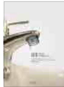
[그림 20] 2009, 일반부 (수도꼭지)