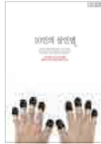
[그림 3] 2013, 일반부 (10인의 살인범)