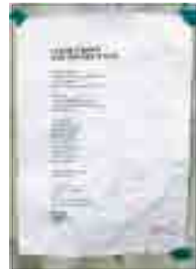
[그림 12] 2011, 일반부 (당신은 변하지 않을 것입니다)