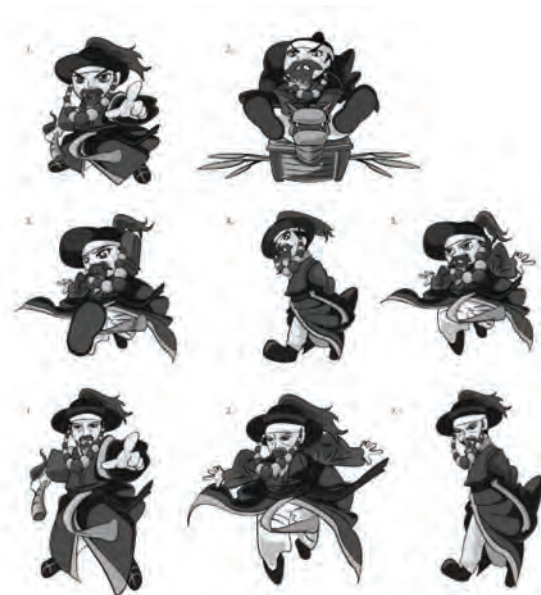
[그림 6] 이세신대교 캐릭터 응용동작