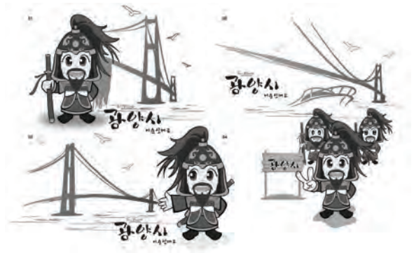
[그림 7] 이세신대교 캐릭터 디자인 응용개발 A