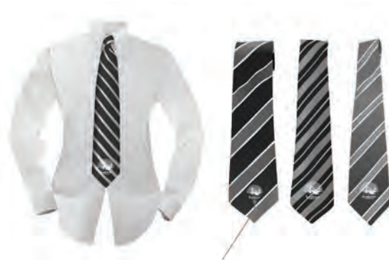
[그림 16] 캐릭터 개발상품 G(넥타이)