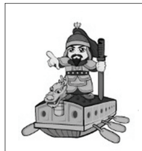
[그림 2] 통영한산대첩축제

통영시에서 주관하는 통영 한산대첩축제에서는 1592년 충무공 이순신장군이 한산도 앞바다에서 전투를 승리하고 이를 기념하기 축제와 관련하여 이순신캐릭터[그림2]를 사용하고 있다. 캐릭터의 형태는 갑옷을 입고 있으며 거북선을 타고 왼손에는 칼을 잡고 있다.