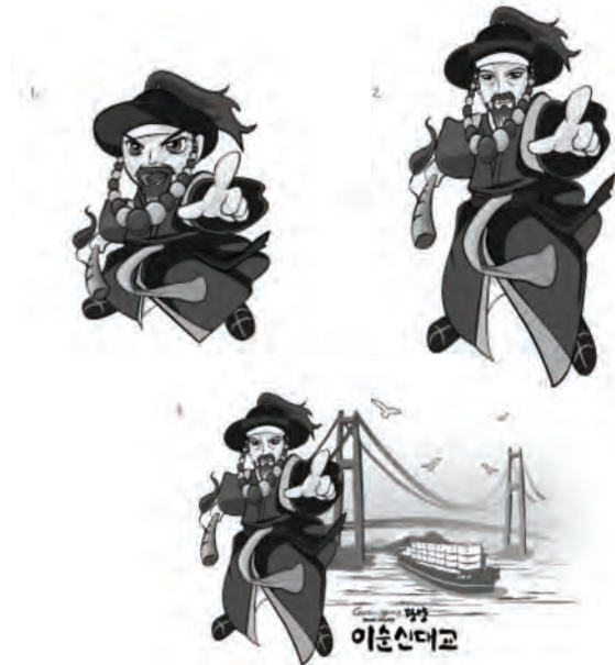
[그림 5] 이세신대교 캐릭터 기본형

작업에 의한 복제방법을 원칙으로 하며, 디자인표준 편함에 제시 된 각 항목별 사용규정에 따라 정확하게 사용되어야 하며, 어떠한 경우라도 임의로 변경 할 수 없다.