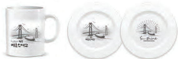
[그림 14] 캐릭터 개발상품 E (머그컵, 접시)