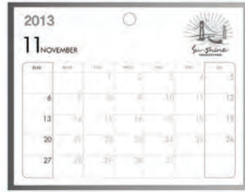
[그림 11] 캐릭터 개발상품 B (캘린더)