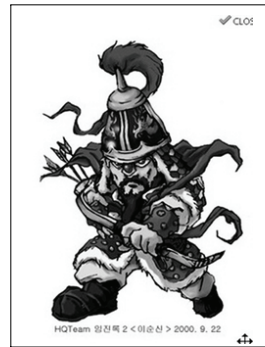
[그림 1] HQteam 임진록2 (게임 캐릭터)

이순신캐릭터디자인 관련 사례는 임진록2[그림1]는 게임캐릭터중에서 이순신장군이 등장하며 조선과 명나라가 일본의 도쿠가와 이에야스와의 전투에서 가상 시나리오를 바탕으로 사용되어지고 있으며 게임캐릭터로서의 단순한 기능만을 보여주고 있다.