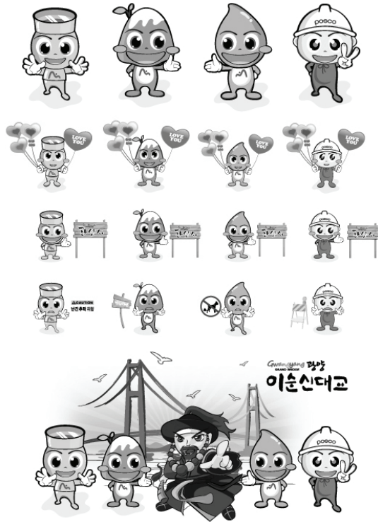
[그림 9] 이순신대교 캐릭터 디자인 응용개발 C