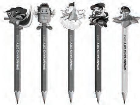
[그림 12] 캐릭터 개발상품 C (연필)