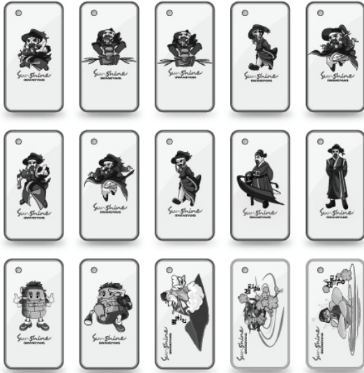
[그림 15] 캐릭터 개발상품 F (휴대폰케이스)