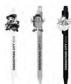
[그림 13] 캐릭터 개발상품 D (볼펜)