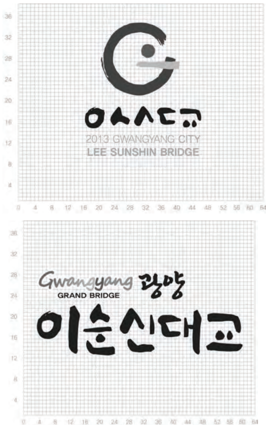
[그림 3] 이순신대교 로고타입

이순신대교의 심볼[그림 3-4]와 같이 2013년 광양시 이순신대교 심볼·캐릭터디자인에 있어서 가장 중요한 요소로써, 모든 시각 커뮤니케이션 활동의 핵심으로, 광양시 이순신대교의 이미지와 의미를 담았다. 광양시는 우리나라에서 일조량이 가장 많은 곳으로 역사적으로도 따스하게 빛나는 햇살이 있는 곳이라는 [희양] 명도, [빛광] 광, [별] 양 의 합성어로, 태양과 연관이 깊다하여 무한한 가능성을 지니고 있는 광양시 이순신대교의 이미지를 다음과 같이 형상화 한 것이다.