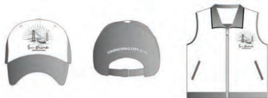
[그림 10] 캐릭터 개발상품 A (셔츠, 모자)

광양시 이순신 대교 캐릭터의 상품화[그림 11-17]과 같이 총13점으로 의류관련 6종류(반팔티셔츠, 조끼, 모자, 넥타이), 기프트상품 4종류(우산, 우편 세트, 머그컵, 접시류), 팬시류 2종류(연필, 볼펜) 모바일상품 1종류(휴대폰케이스)로 개발 되었다.